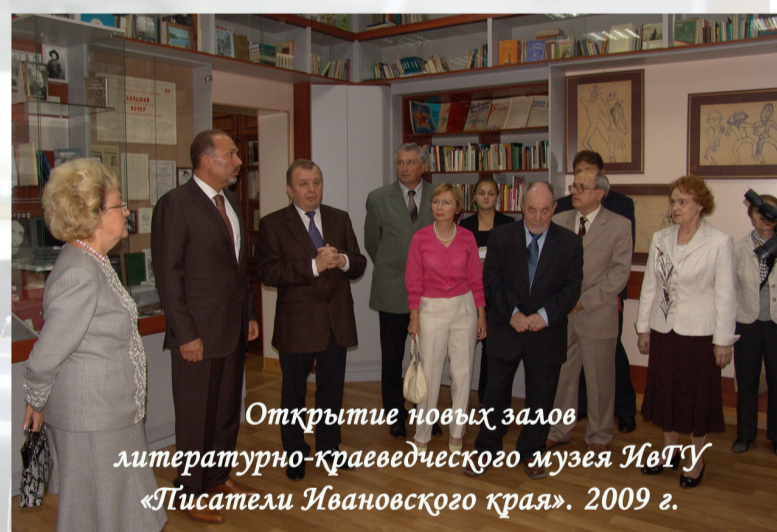
Открытие новых залов литературно-краеведческого музея ИвГУ «Писатели Ивановского края». 2009 г.