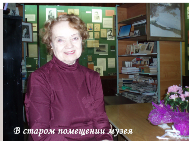
В старом помещении музея