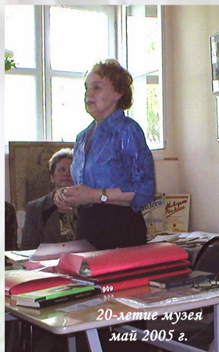
20-летие музея май 2005 г.